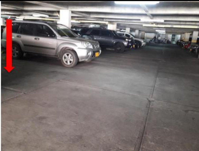
IMAGEN No. 14: Donde se observa el lugar de salida del parqueadero del conjunto residencial Torres de Santa Lucia.